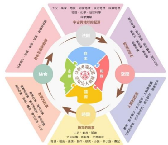
臺北市忠義實驗國民小學課程架構圖

本校採四學季課程安排，進行跨域混齡之沉浸學習。以蒙特梭利之宇宙教育課程(包含天文、物理、化學、地理、生物、歷史、語言、數學、藝術、人類學…)為核心，幫助孩子建立整體性的世界觀；另結合外出課(outing)、本土語文、英語文、健康與體育、資訊素養、動靜態社團選修等課程活動，深化學子善用學習工具，及提升學習策略之自主學習素養，接軌世界、邁向永續。